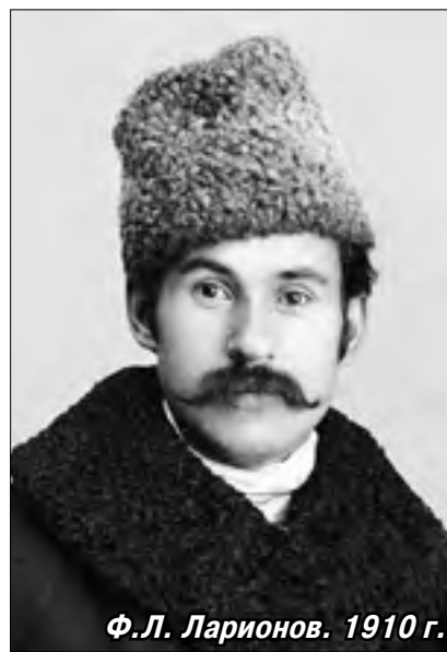
Ф.Л. Ларионов. 1910 г.