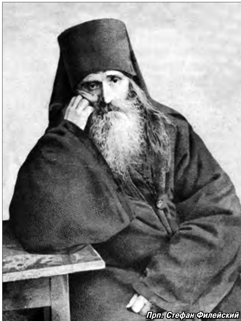
Прп. Стефан Филейский

О пьяницы, невольники дьявола, сообщники сатаны, будущие наследники преисподнего ада! Пьяницы — враги Креста Христова, искоренители всякого блага, идущие по широкому пути в погибель! Не пора ли вам вразумиться и познать гибельное своё состояние? Не пора ли оставить пьянство и искать примирения с Богом? Но... едва ли кто вразумит вас бежать от грядущего на вас страшного гнева Божия! Вам пьянство кажется пустяками, за которое будто не будет суда: попить, песен попеть и поплясать или вдаться в пустословие, смехотворство — это вам кажется не бедовым делом. Иной пьяница говорит ещё: «Я люблю только выпить, а больше ни в чём не виноват; но