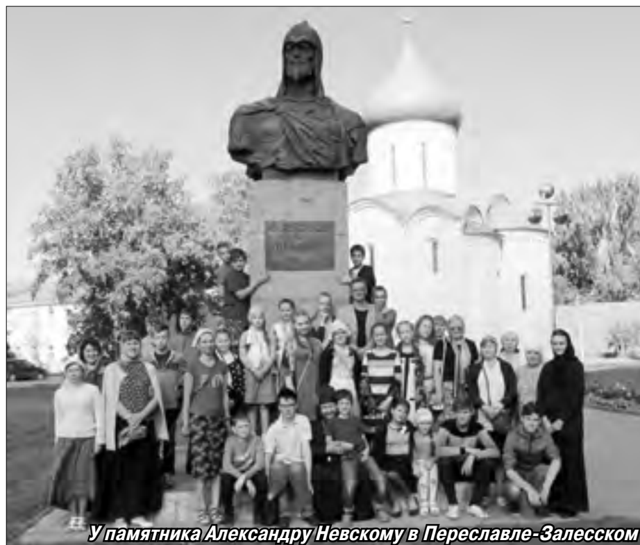
У памятника Александру Невскому в Переславле-Залесском

После фотографирования у памятника святому Александру ребята погуляли по крепостным валам и берегу озера Плещеево, где стоит замечательный храм Сорока севастианских