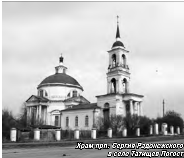
Храм прп. Сергия Радонежского в селе Татищев Погост

опыт итальянского архитектора Андреа Палладио (1508–1580). Внутри храм богато украшен изящными гипсовыми розетками, гирляндами, карнизами и фризом. Интерьер дополняют колонны, полуколонны и пилястры, выполненные в духе строгого классицизма. В центральном приделе по кругу стоят колонны с гипсовыми изразцами, которые венчаются хорами. Создается впечатление полёта, небесности!