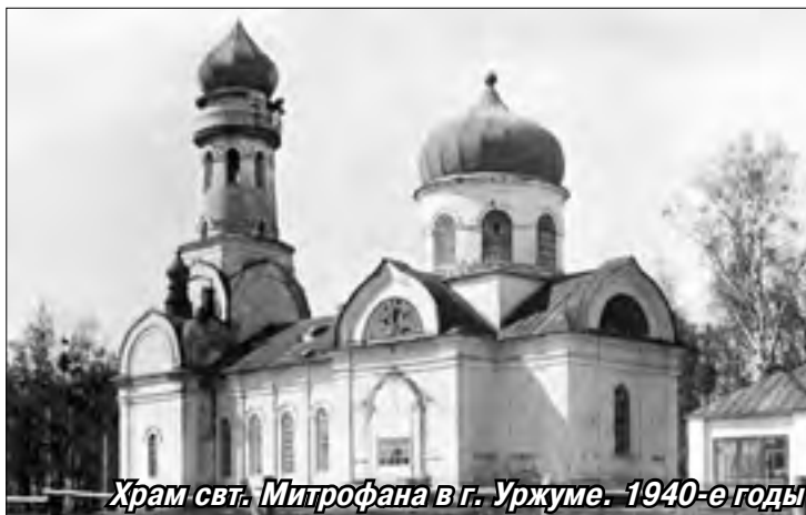
Храм свт. Митрофана в г. Уржуме. 1940-е годы

Кладбищенский храм свт. Митрофана, епископа Воронежского, был заложен в г. Уржуме в 1843 году, строительство закончено осенью 1846 года. Он, как и другие церкви города, дал имя улице, которая до переименования в советское время носила название Митрофановской.