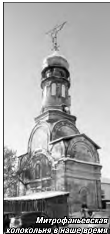
Митрофаньевская колокольня в наше время