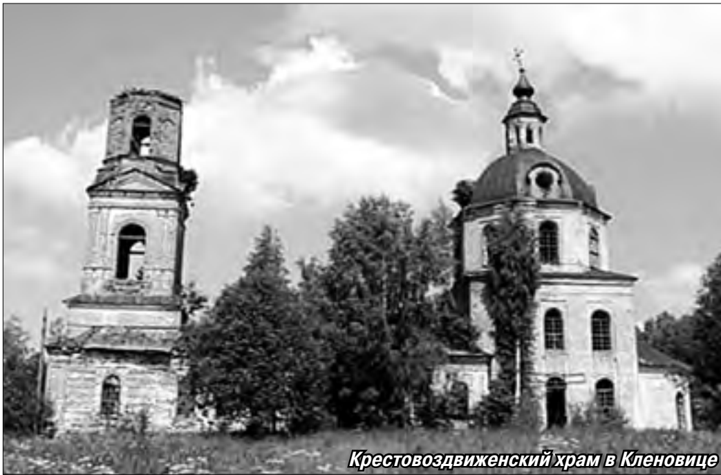
Крестовоздвиженский храм в Кленовице