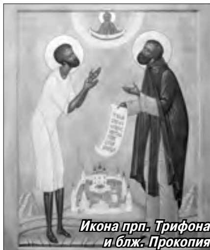
Икона прп. Трифона и блж. Прокопия