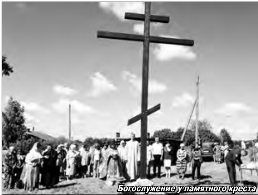
Богослужение у памятного креста