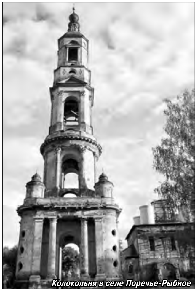
Колокольня в селе Поречье-Рыбное

Наш путь лежал в Переславль-Залесский, родину Александра Невского. По дороге мы едем в село Поречье-Рыбное, где находится