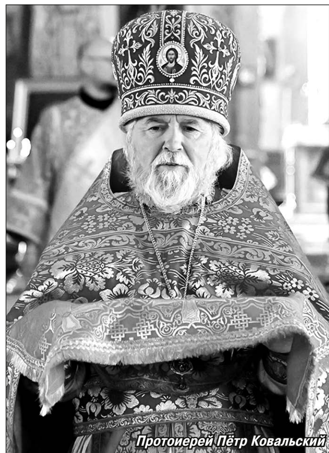
Протоиерей Пётр Ковальский