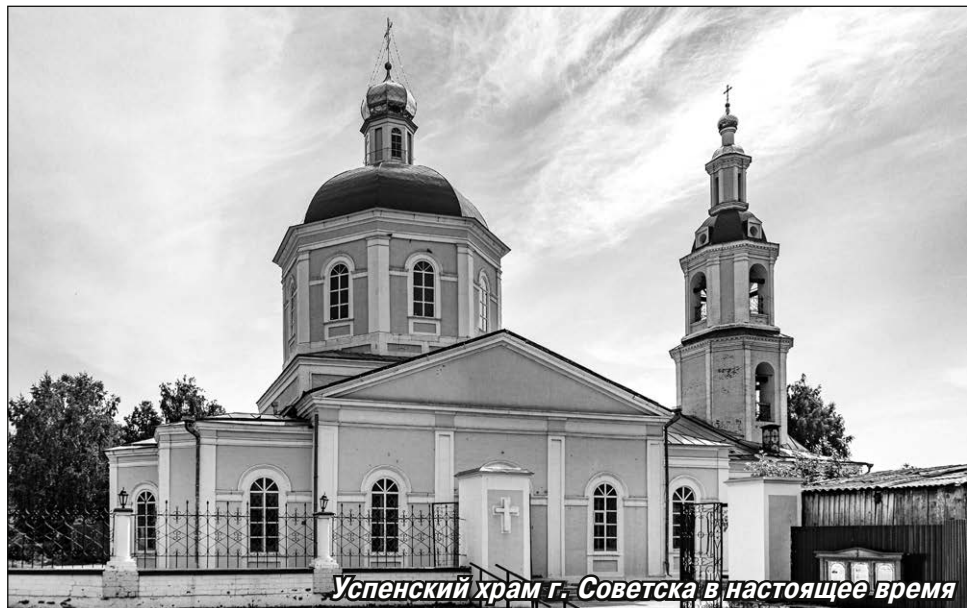
Успенский храм г. Советска в настоящее время