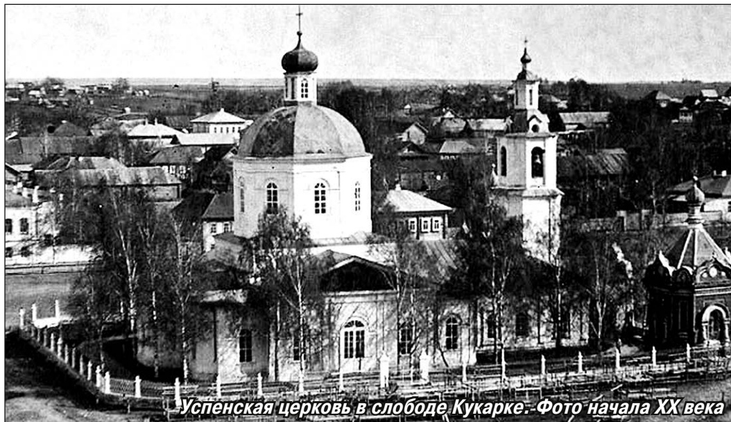
Успенская церковь в слободе Кукарке. Фото начала XX века