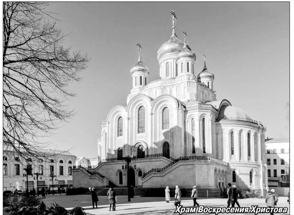
Храм Воскресения Христова