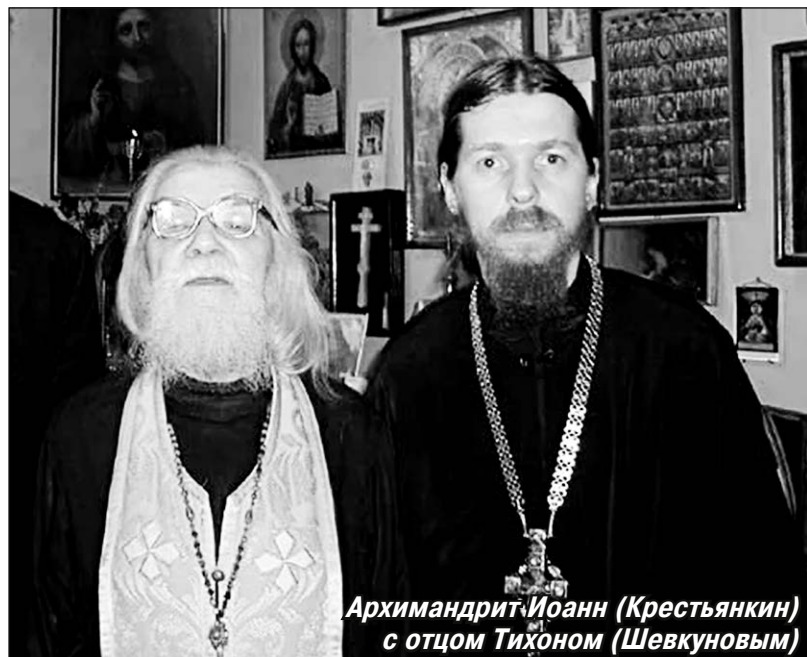
Архимандрит Иоанн (Крестьянкин) с отцом Тихоном (Шевкуновым)

Владыка Тихон вспоминал ещё: «Со дня открытия подворья всегда, в дни радостей и испытаний, нас поддерживала молитва, благословение, а иногда и строгое взыскание архимандрита Иоанна (Крестьянкина). Он передал нам множество своих икон, в том числе и любимую Владимирскую. Батюшка благословил создание монастырского издательства, семинарии, подсобного хозяйства. Вообще, особенно в первые, самые сложные годы он следил буквально за каждым шагом в возрождающейся обители. А после именно отец Иоанн благословил просить Святейшего о преобразовании подворья в Сретенский монастырь».