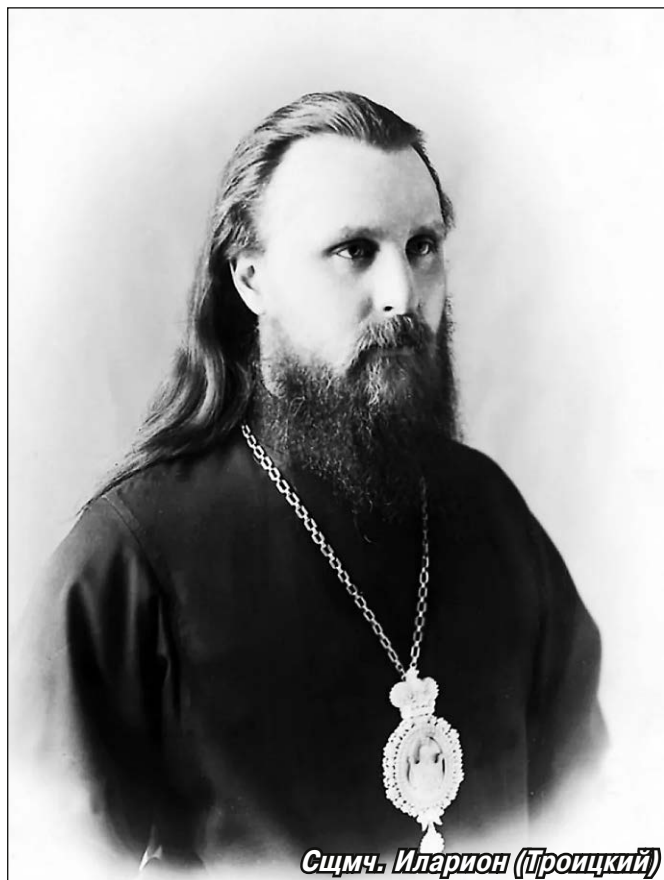
Сщмч. Иларион (Троицкий)

знания и проведшего меня не через иную какую школу, но через школу духовную». В десять лет мальчик поступил в Тульское духовное училище, затем продолжил образование в Тульской духовной семинарии и, наконец, поступил в Московскую духовную академию.