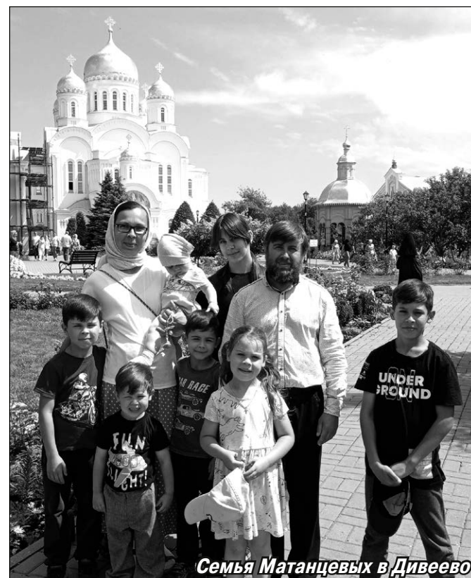
Семья Матанцевых в Дивеево

До Арзамаса добираться на поезде, а там пересаживаемся на такси и едем в Дивеево. Иногда случаются дорожные приключения. В том году произошла заминка, и мы отправились из дома на вокзал не вместе: сначала матушка уехала с тремя детьми и всеми сумками, а я со старшими несколько позднее. Пять часов вечера, в городе пробки. Понимаю, что не успеваем. Звоню супруге — а её с ребятами в вагон не садят, так как документы у меня — и прошу как-то задержать поезд. Приезжаем со старшими детьми на вокзал, бежим по перрону к нашему вагону. На семь минут проводница