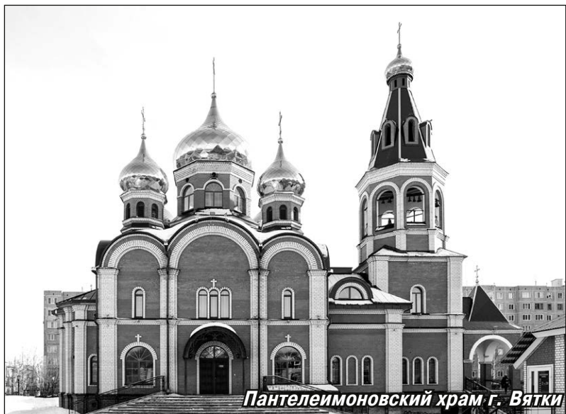
Пантелеимоновский храм г. Вятки

осознания, что родителей нет рядом. Я ещё не был воцерковлённым человеком, но душа попросила, и я приобрёл молитвослов и Псалтырь и начал читать их. Молитва стала для меня духовной опорой. Поэтому и других людей, попавших в скорбные жизненные обстоятельства, всегда прошу находить утешение в молитве. Одним словом, о служении в Покровском храме у меня остались очень добрые воспоминания. Так что, когда один батюшка спросил меня, не грустно ли мне было служить на кладбище, я искренно ответил, что нет.