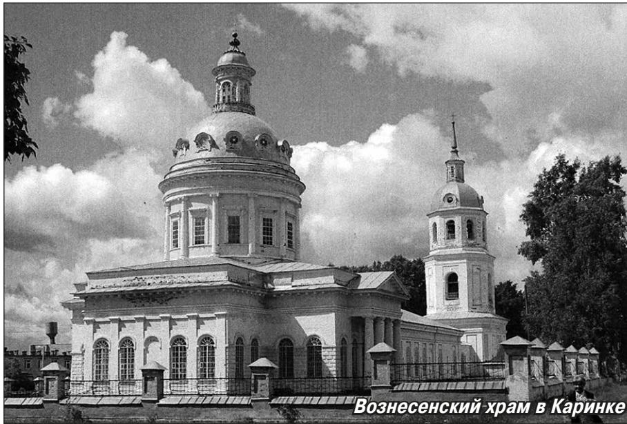
Вознесенский храм в Каринке

— Он является памятником архитектуры федерального значения, включён в единый