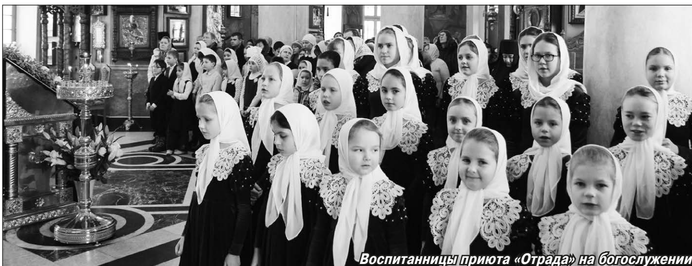
Воспитанницы приюта «Отрада» на богослужении

К началу XX столетия Никольский монастырь полностью отстроился. В нём действовал водопровод, имелись собственные оранжерея, пруд, небольшой кирпичный завод, открылась церковно-приходская школа. Но процветала обитель недолго, до октябрьского переворота 1917 года. Уже в сентябре 1918-го советская власть решила национализировать монастырское имущество. Был утрачен богатейший архив и библиотека, где в том числе хранились грамоты и акты XVII века, пропали ценнейшие иконы, ризница, церковные сосуды и многое другое. После разграбления обители постепенно её постройки пришли в аварийное состояние. В середине 1920-х годов Никольский монастырь покинули последние иноки. В 1925-м предполагалось разобрать все здания на кирпич. От полного разрушения обитель была спасена благодаря усилиям Н.П. Ильина, члена Калужского общества истории и древностей, впоследствии заключённого за это в тюрьму. В 1939 году в Никольском соборе открылась экспозиция музея войны 1812 года, который потом переместился в здание бывшей часовни, а монастырь заселили жильцами. Позже на его территории размещались педагогический и