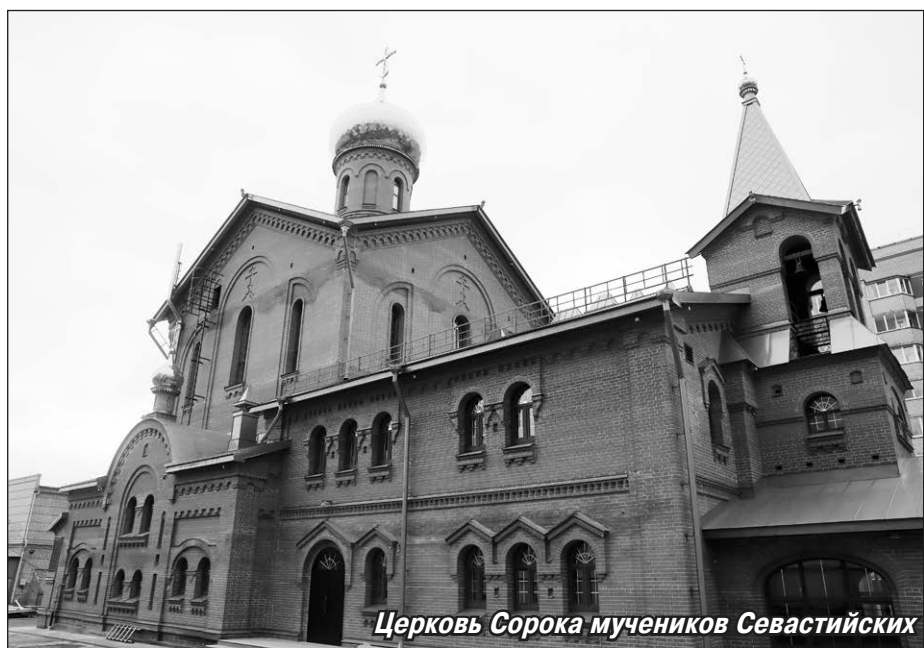
Церковь Сорока мучеников Севастийских