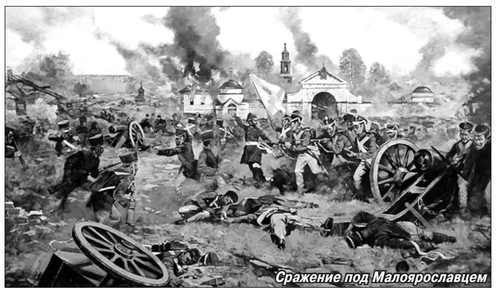
Сражение под Малоярославцем

Из 200 домов в Малоярославце уцелели сокровища. Церкви были разграблены, одна сожжена, на другой появилась надпись: «Конюшня генерала Гельямино», внутри — следы пребывания лошадей. Улицы были завалены трупами людей и коней вперемешку с ранеными.