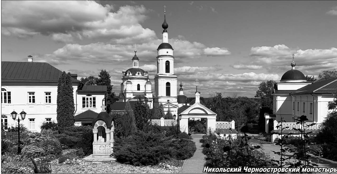
Никольский Черноостровский монастырь