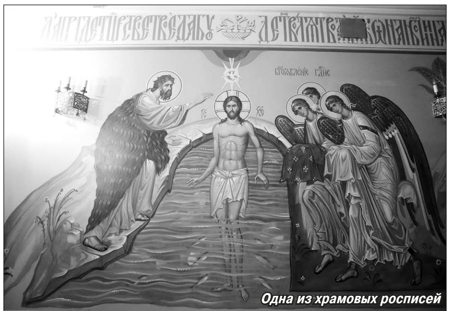
Одна из храмовых росписей