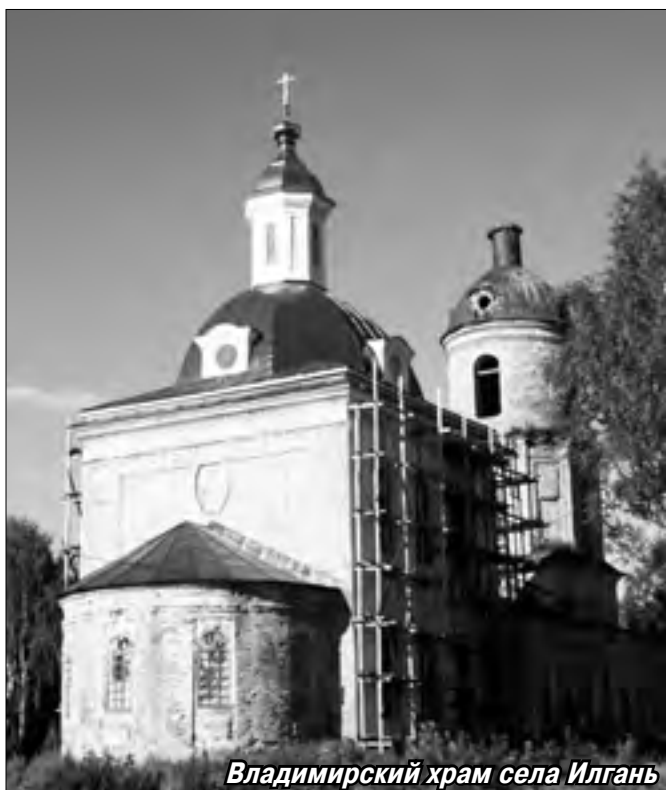
Владимирский храм села Илгань

возрождении колокольни Петропавловского храма. И вот уже сверкают на солнце освящённые крест и главка. Предстоит заменить межэтажные перекрытия, провести капитальный