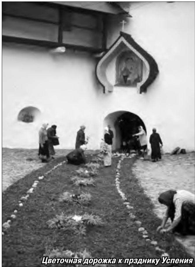
Цветочная дорожка к празднику Успения

Началась революция. Епископ Иоанн хотел поставить опытного отца Вассиана заместителем монастыря, но тот по смирению отказался, осознавая, что это послушание ему не под силу, и чувствуя «внутреннее внушение принять