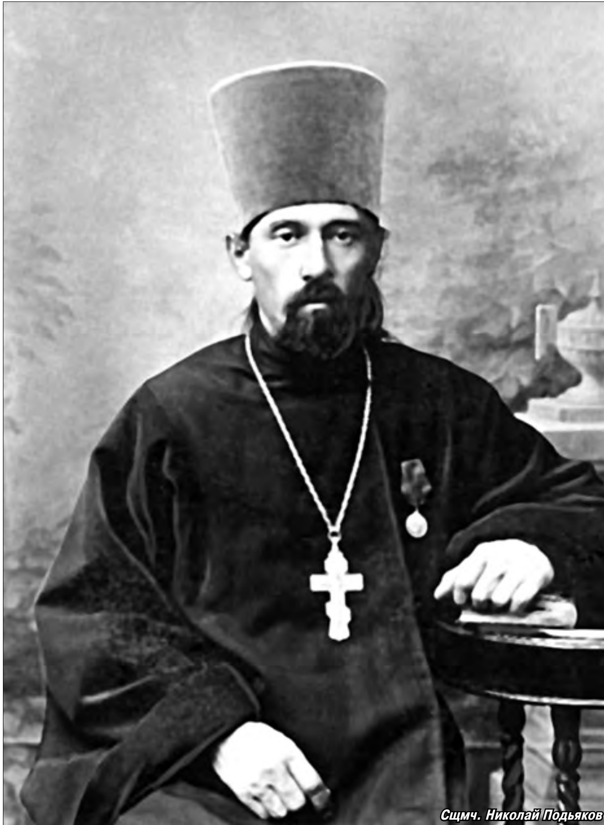
Сщмч. Николай Подьяков

24 сентября 1918 года доброжелатели предупредили отца Николая, что в этот день его арестуют и что остаётся немного времени, чтобы скрыться. Карательный отряд явился в село после полудня. «Где священник?», — спрашивали чекисты. Никто не хотел указать. «Ну что ж, если не появится, возьмём младшего