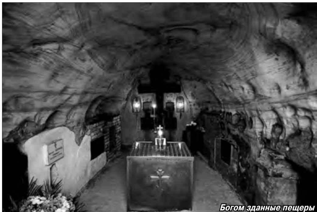
Богом зданные пещеры