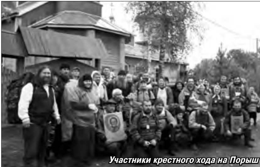
Участники крестного хода на Порыш