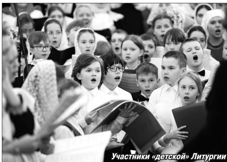
Участники «детской» Литургии

Всего в патриаршей Литургии от Вятской епархии приняли участие более 60 детей. Перед путешествием ребята с родителями помолились на молебне на начало доброго дела. В Москве нас встретили организаторы, провели обзорную