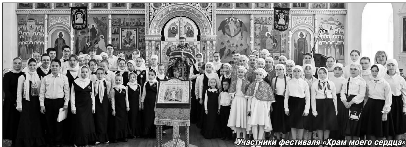
Участники фестиваля «Храм моего сердца»

По окончании Божественной литургии, где пели ребята из сводного хора Вятской