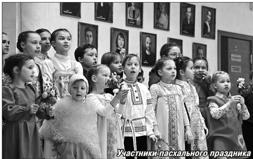
Участники пасхального праздника