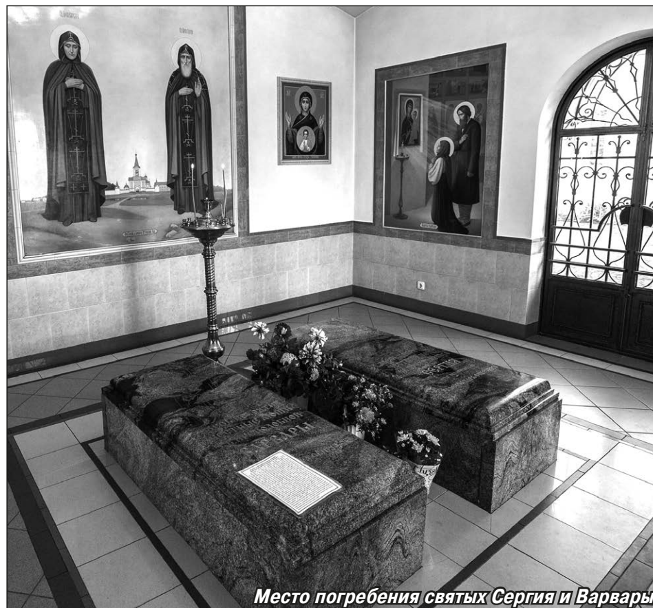
Место погребения святых Сергия и Варвары