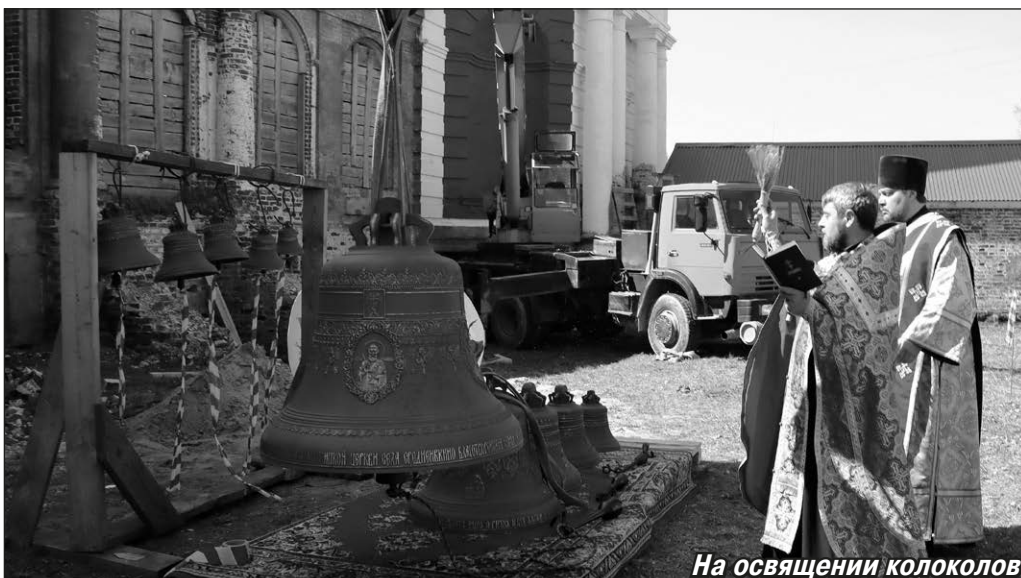
На освящении колоколов

Поначалу стояла задача хотя бы сохранить храм от дальнейшего разрушения, для чего необходимо было законсервировать здание.