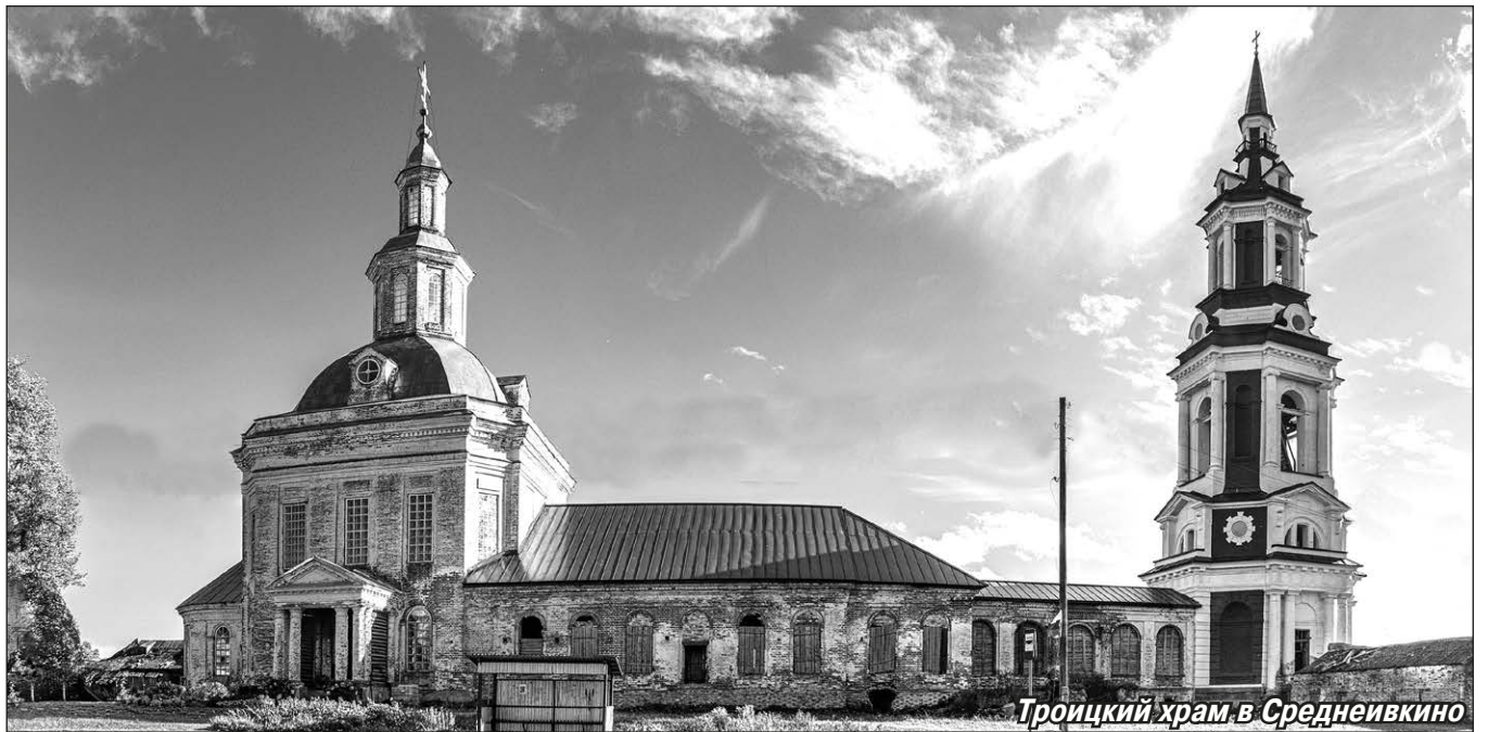
Троицкий храм в Среднеивкино

Одна девочка, учащаяся местной школы, когда услышала о проекте «Благовест», попросила у мамы разрешения распечатать копилку, и все свои 2300 рублей она отдала на колокола. Когда размышляешь над её поступком, вспоминается одно евангельское событие: бедная вдова пожертвовала на иерусалимский храм всего две лепты, очень маленькую сумму, но Христос сказал, что она дала больше всех, потому что другие жертвовали от избытка