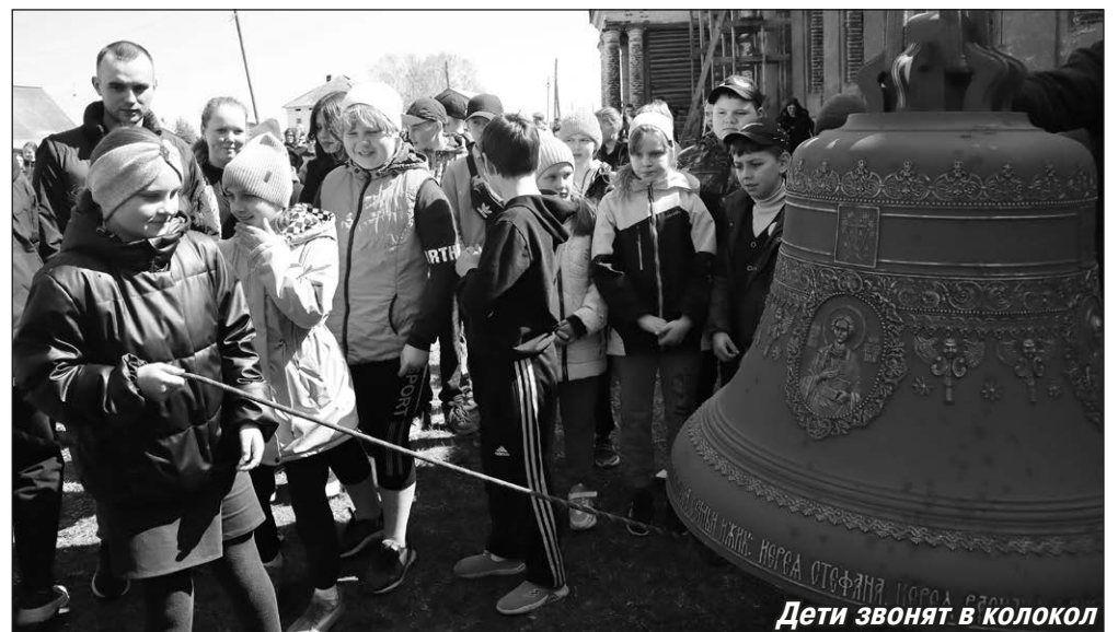
Дети звонят в колокол