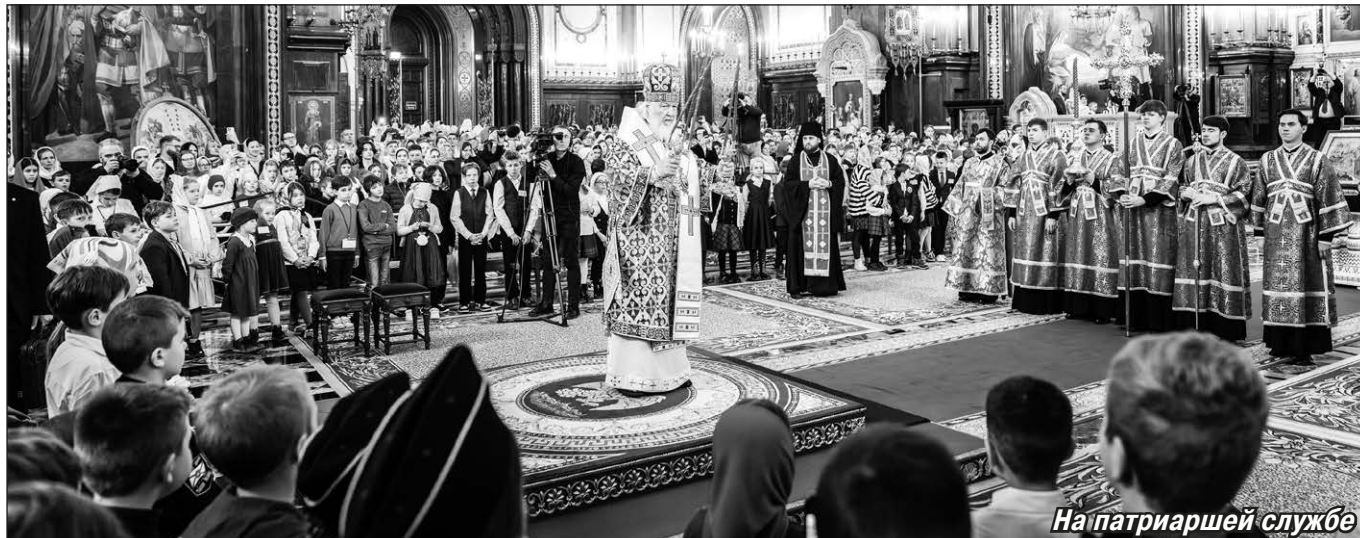
На патриаршей службе

12 мая, в праздник Антипасхи, в кафедральном Храме Христа Спасителя в Москве Святейший Патриарх Московский и всея Руси Кирилл совершил традиционную «детскую» Божественную литургию, в которой приняли участие в качестве поющих и прислуживающих в алтаре ребята отроческого возраста, в том числе и детский хор Вятской епархии.