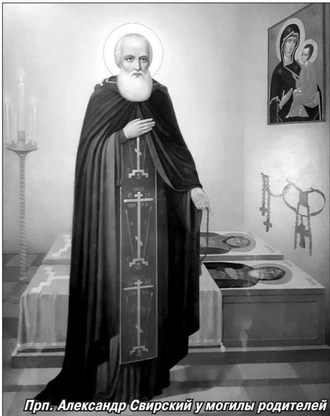
Прп. Александр Свирский у могилы родителей

На территории обители была организована коммуна «Пролетариат», а в марте 1919 года монастырь окончательно упразднили. Иноки покинули его стены, кроме иеромонаха Николая (Сергиевского), вошедшего в коммуны, образованную из рабочих, которые до революции обрабатывали земли обители. Он не отрёкся от священного сана и монашеского звания, более