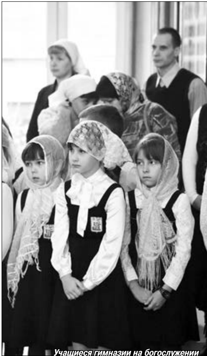
Учащиеся гимназии на богослужении

— У всего должна быть своя защитная граница. Раньше, когда основывали город, делали крепостную стену; монастырь ставился, и у него была стена, чтобы мир у неё призадержался. И у души человека должна быть некая защитная крепость. В прежние времена ей яв-