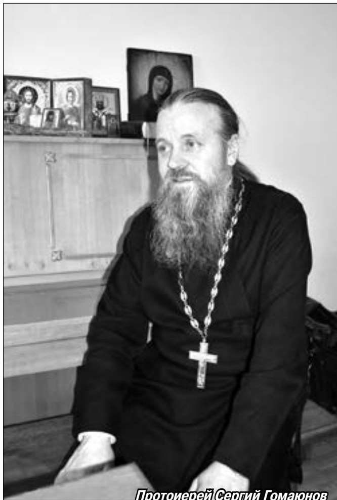
Протоиерей Сергей Гомаюнов