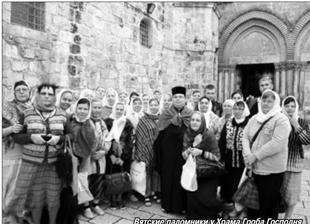
Вятские паломники у Храма Гроба Господня

Спустя годы визы отменили, а паломнические группы стали сопровождать опытные местные гиды, которые хорошо разбираются в Православии. Некоторые из