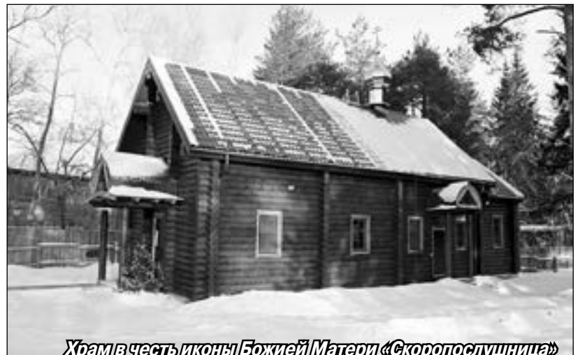
Храм в честь иконы Божией Матери «Скоропослушница»