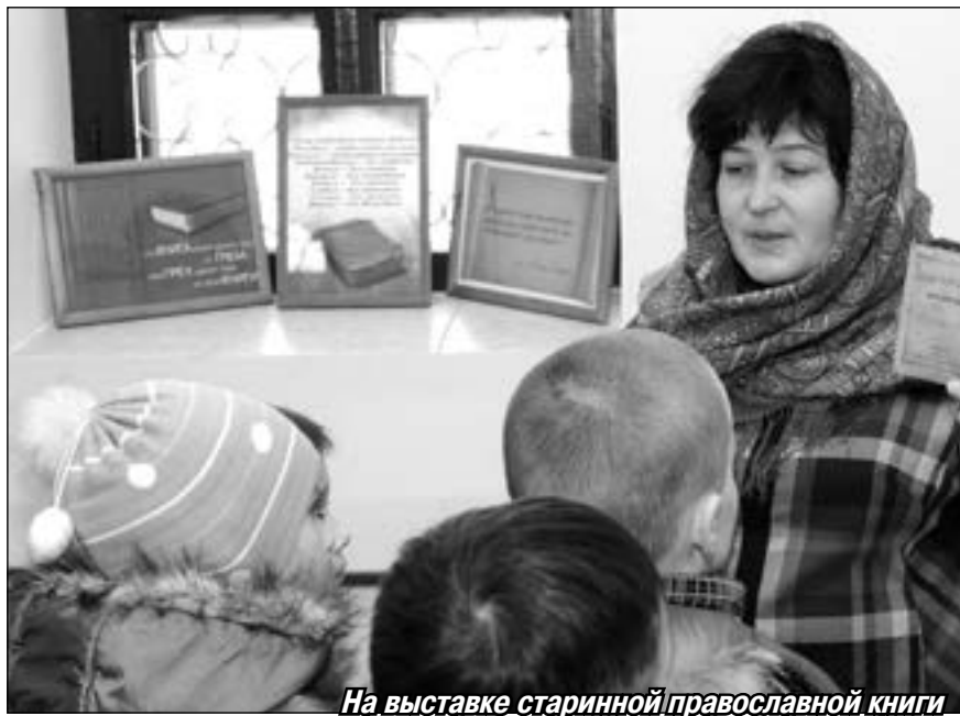
На выставке старинной православной книги

В этот же день в воскресной школе при Всехсвятском храме прошёл традиционный круглый стол «Семейное чтение — тропинки духовного возрастания». В самом большом классе собрались ученики и выпускники взрослого отделения воскресной школы. Здесь же была представлена экспозиция православных книг, подготовленная сотрудниками приходской библиотеки воскресного чтения.