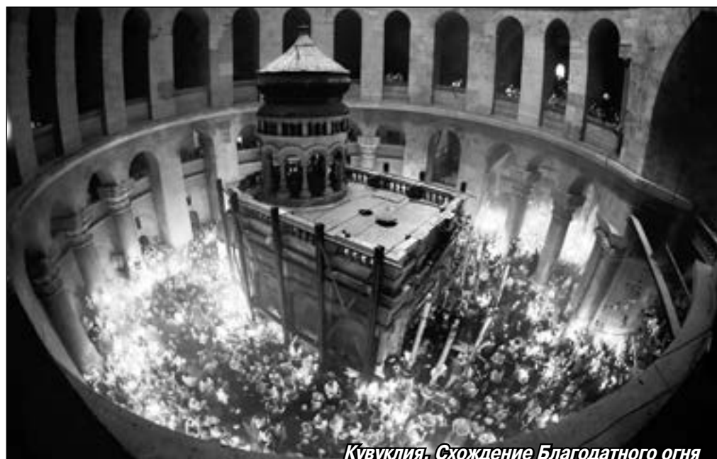
Кувуклия. Схождение Благодатного огня

Здесь, на месте Воскресения Христова, мы завершили Крестный путь Спасителя, и вот Господь нас снова проверяет на смирение, терпение и любовь. Помню, с одной группой мы никак не могли попасть в кувуклию: то служба начнётся, то народу очень много, то перед нами почему-то преграждают путь. Завтра мы должны были уезжать на север Израиля, соответственно, попасть сюда в другой день шансов было мало. Я предложила приложиться к части Гроба Господня в коптском приделе, но несколько наших паломниц гневно заявили мне: «Делайте, что хотите, но мы должны попасть в кувуклию, мы за это деньги заплатили!». Я стояла и не знала, что им ответить: причём здесь деньги, когда только Господь решает, кого допустить к Своей величайшей святине? Смогла лишь сказать: «Молитесь», — а сама, отойдя, уткнулась в наружную стену кувуклии и долго просила Бога быть милостивым к нам. Конечно, в тот вечер молилась и слёзно просила прощения вся наша группа. Наутро, перед отъездом, Милостивый Господь нас допустил внутрь кувуклии!