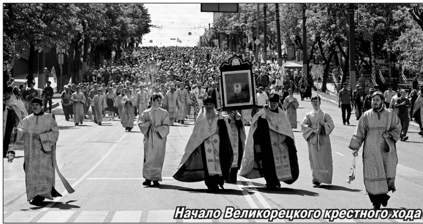
Начало Великорецкого крестного хода

И не погибнет Мать-Россия, Пока идёт из года в год, Идёт, идёт в места святые Великорецкий крестный ход.