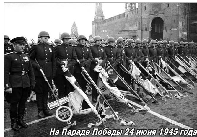
На Параде Победы 24 июня 1945 года

Перед Парадом Победы всю ночь не мог сомкнуть глаз — такое было волнение. А едва нас подвезли к Красной площади, пошёл дождь. Сапоги предательски покрылись пылью, мундиры промокли. За несколько минут до назначенного времени оркестр заиграл мелодию