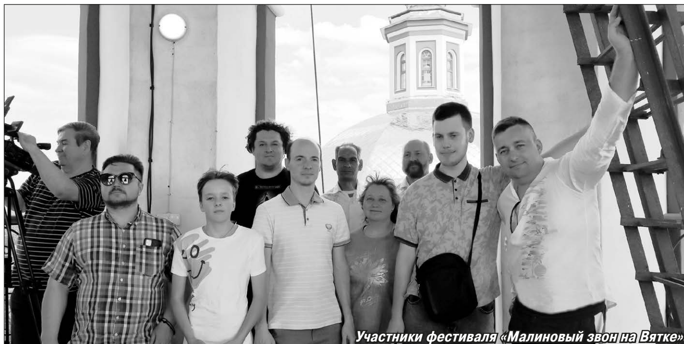
Участники фестиваля «Малиновый звон на Вятке»