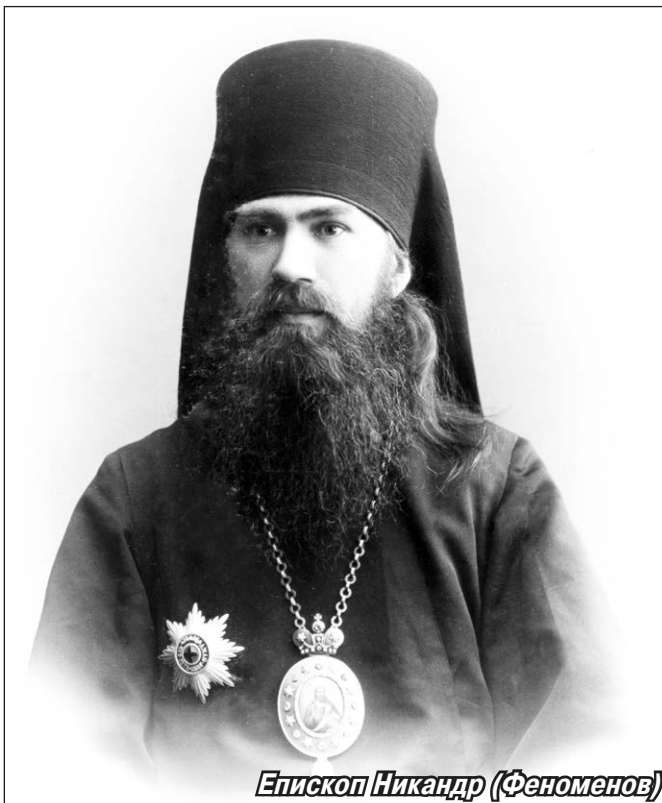
Епископ Никандр (Феноменов)

В этом же печально известном узилище находился в то время в третий раз лишённый