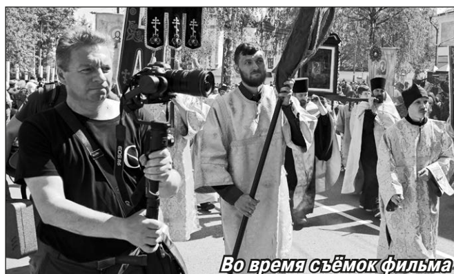
Во время съёмок фильма

— Вы автор документальных фильмов. Чем они отличаются от телевизионных репортажей или роликов видеоблогеров?