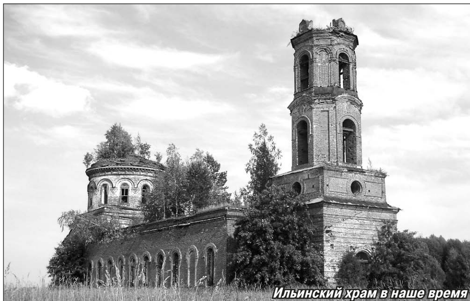
Ильинский храм в наше время