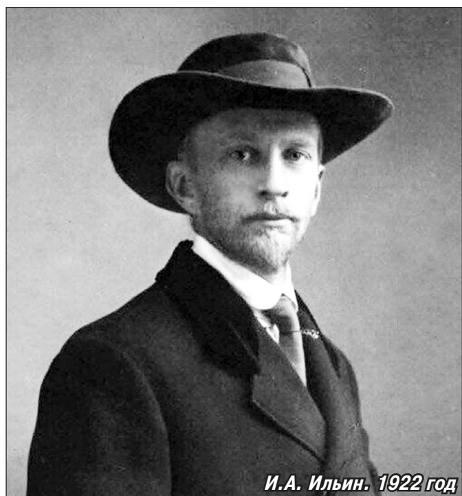
И.А. Ильин. 1922 год